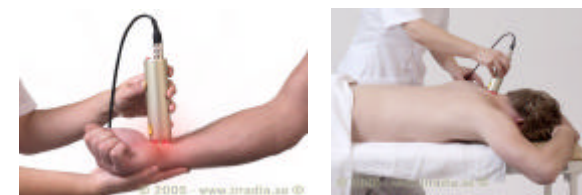
Behandling av karpaltunnelsyndrom. Behandling av whiplashskada

Djupa problem i rygg, nacke, axlar och knän, tendinit, artros och myofasciella smärtor.